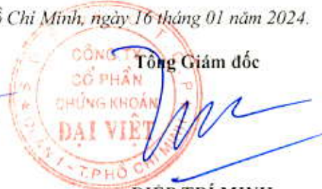
DIỆP TRÍ MINH