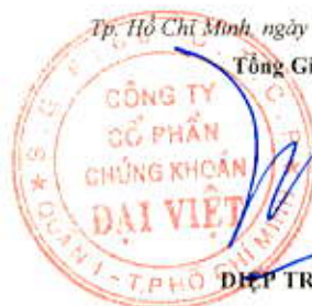
ĐIẾP TRÍ MINH