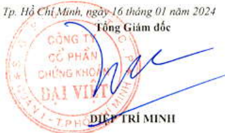
DIỆP TRÍ MINH